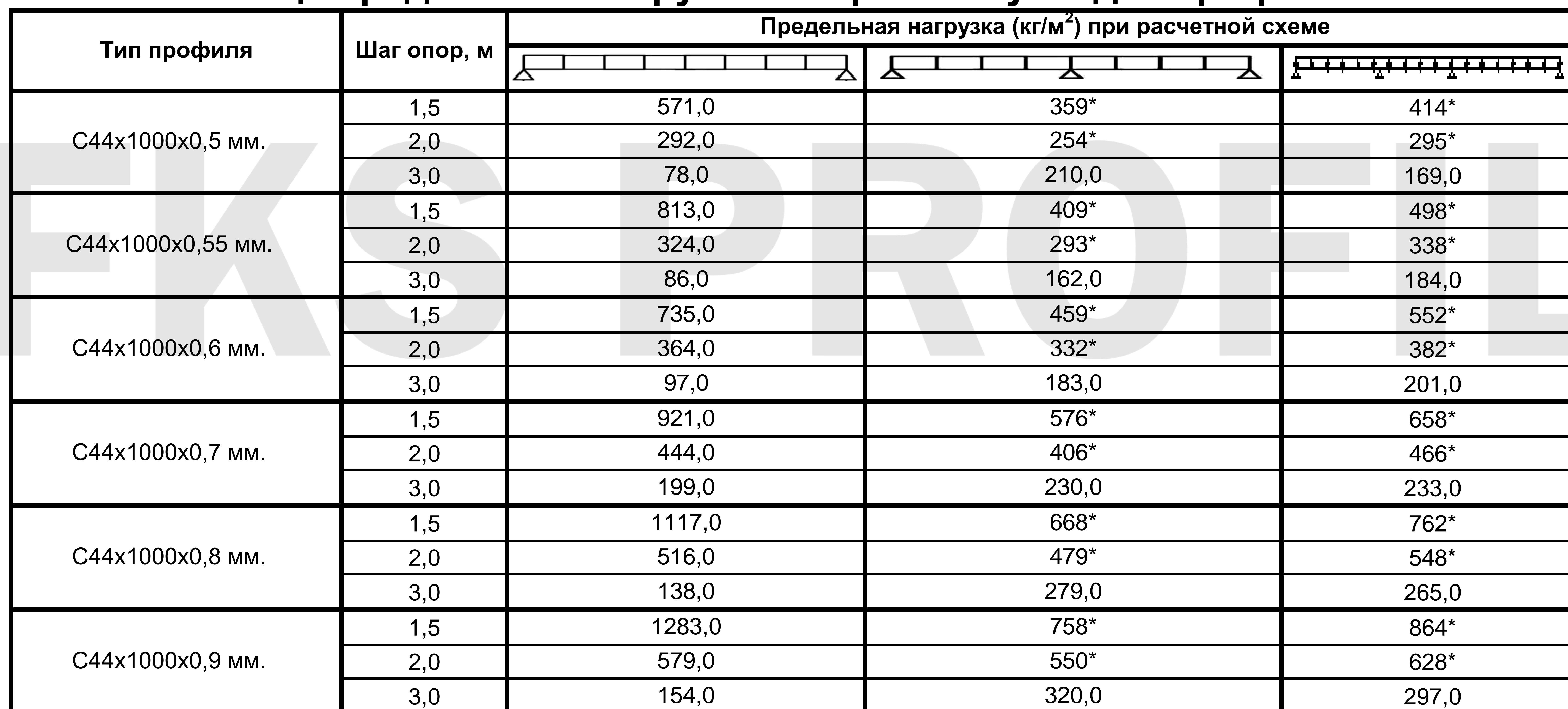
Таблица предельных нагрузок и варианты укладки профнастила

* Для повышения несущей способности настила предлагается усилить надопорные участки вкладышами из отрезков профилей того же типа.